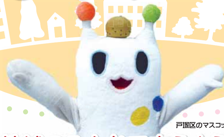
戸塚区のマスコット ウナシー